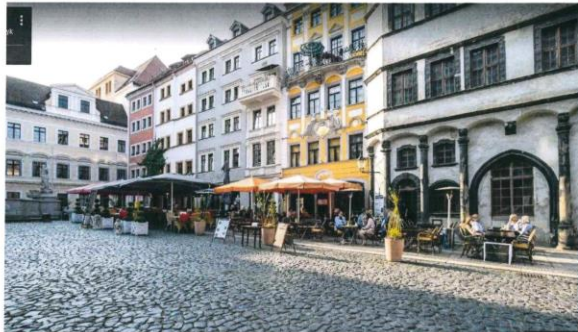
Bild 2: andere Sicht, da befindet sich das Rathaus auf der linken Seite und eine Art Arkaden auf der rechten Seite hinten.

Anhang: Bild 1: im Hintergrund das Rathaus und an der Seite Restaurants